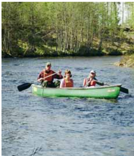
Um Vemdalen herum befinden sich stille Gewässer für Paddeltouren mit der gesamten Familie.